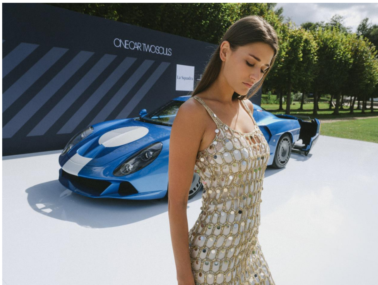
AGTZ Twin Tail.

Produkcja AGTZ Twin Tail została ściśle ograniczona do 19 egzemplarzy. Model bazuje na cenionym za swoje właściwości jezdne i stanowiącym potwierdzenie związku z A220 współczesnym A110 S. Proces ręcznej przebudowy AGTZ Twin Tail w Atelier Zagato w Mediolanie dla najbardziej cenionych na świecie kolekcjonerów oraz miłośników motoryzacyjnej sztuki już się rozpoczął. Lista zamówień wkrótce zostanie zamknięta - zostały na niej ostatnie wolne miejsca.